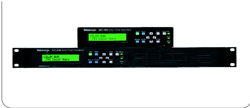
► SPG600(全机架宽)和SPG300(半机架宽)系列同步信号发生器

SPG600 和 SPG300 同步脉冲信号发生器，可为传统的模拟环境或数字与模拟混合工作环境提供同步和测试信号输出，这种工作环境既可以是 NTSC/525 格式，也可以是 PAL/625 格式。利用 SPG600 和 SPG300 同步脉冲发生器来产生一种稳定可靠的台主同步信号是很理想的。这样的同步信号对于数字电视播出环境来说是十分重要的。如果将 SPG600/SPG300 配置为 Stay GenLock™ 模式，那么，在基准输入锁定时即便有瞬时的同步丢失，也不会对该设备的测试信号输出和黑场输出造成干扰。当锁定信号再次出现时，SPG600/SPG300 系统会逐渐获取锁定，对其输出信号只有很小的扰动，但不会对 SPG600/SPG300 的输出带来任何可觉察的影响。锁定信号源既可以是 NTSC/PAL 黑场色同步信号，也可以是 NTSC/PAL 同步信号或 CW(连续波)信号。如果采用 CW 锁定方式，则可以对整个 NTSC 或 PAL 彩帧进行锁相定时调整。